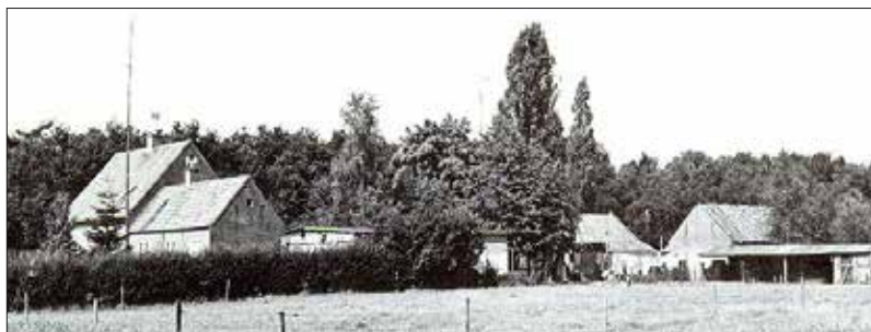
Voorste Straakven 1982