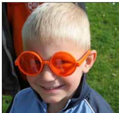
Koningsspelen basisschool de Korenaar

... maar er staat in dit nummer van de Corridor veel meer te lezen, dus veel leesplezier gewenst.