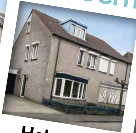
Helmond Nierslaan 5